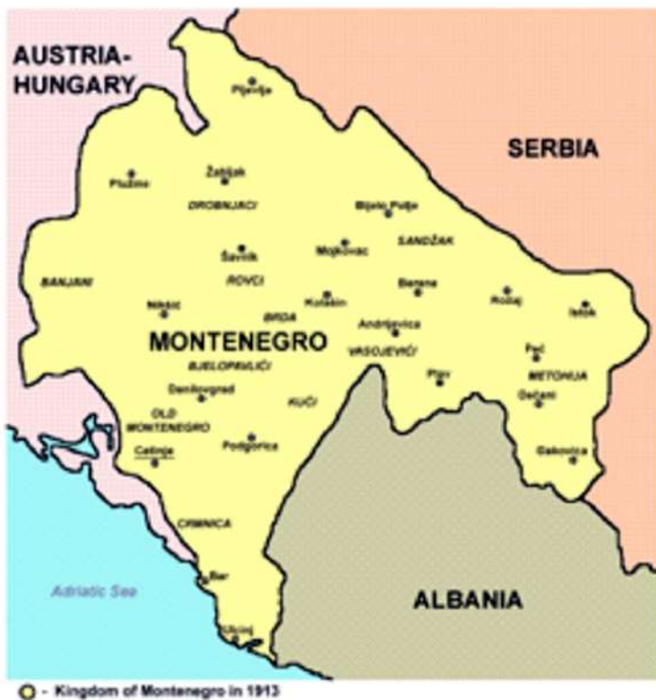
Crna Gora pred I sv. rat

Bokokotorskog zaliva, a uz pomoć francuske flote potopljena je austrougarska krstarica „Zenta“. 17 Takođe i Hercegovački odred, iako se držao defanzivno, održavao je front prema Grahovu. I najmanji Starosrbijanski odred imao je uspjeha i štiteći granicu od albanskih upada zauzima Skadar 27. juna 1915. godine, što je izazvalo negodovanja čak i među silama Antante.